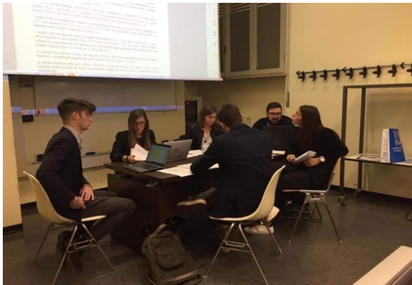
Consigliato 18 volte

Una didattica qualificata e interattiva , arricchita da seminari, testimonianze in aula, project work, che consente anche lo sviluppo delle soft skills